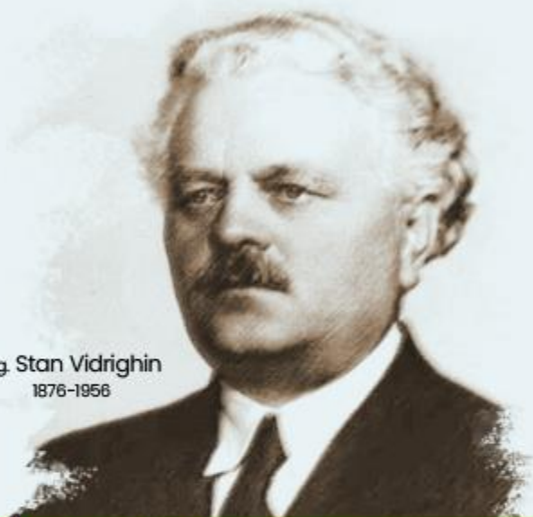
ing. Stan Vidrighin 1876-1956